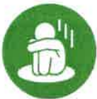
CASE 01 こども