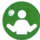
CASE 02 パパやママなど